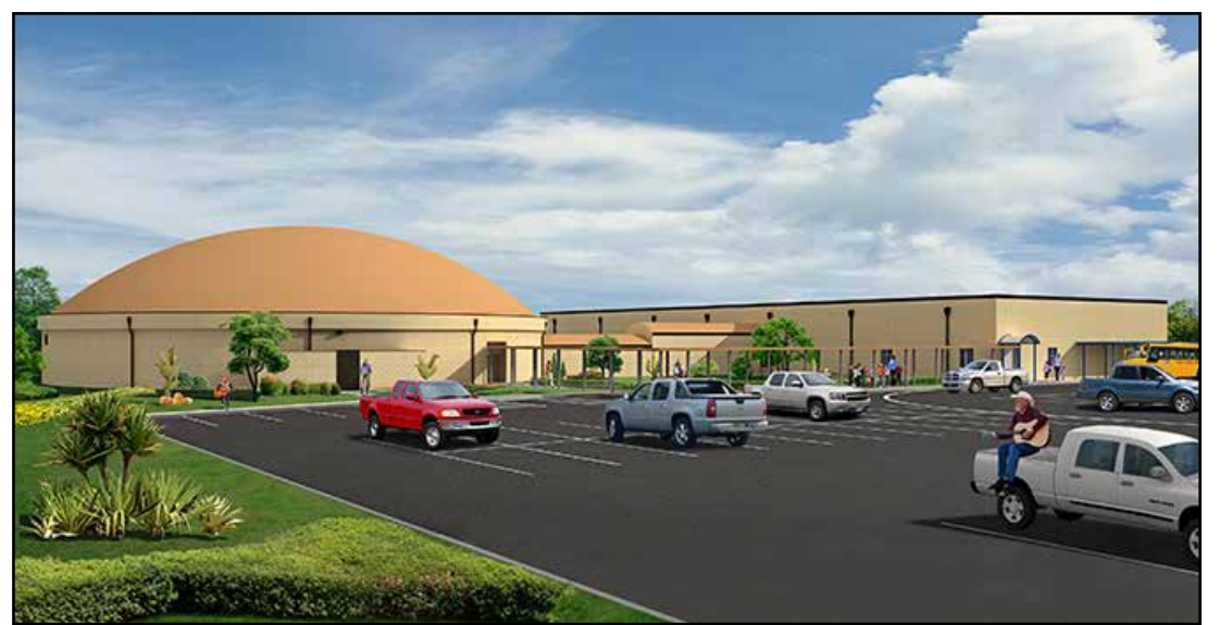
Una idea de cómo la caja fuerte / Gimnasio en Eastland puede quedar Equipo de ABC Doms para construir FEMA-* caja fuerte / Gimnasio en Eastland, Texas

También nos gustaría recordarle que usted es responsable de su banqueta, las zanjas, y la mitad de su callejón. Así que asegúrese de incluir esas áreas cuando corte el césped. Sin previo aviso, los oficiales del Departamento de Policía emitirán citaciones a las propiedades que se encuentran en violación. Por favor, haga su parte en mantener su propiedad limpia y ayudar a limpiar la ciudad