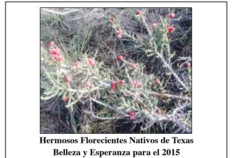
Hermosos Florecientes Nativos de Texas Belleza y Esperanza para el 2015

$100 en el caso de suministros para un mes, según un análisis realizado por AARP Bulletin. Por ejemplo, entre 31 planes de California, un suministro para 30 días de Lantus SoloSTAR, una insulina, costará entre $24 y $170 en el 2015; 14 de los planes cobrarán menos de $45 al mes y ocho de los planes cobrarán más de $80.